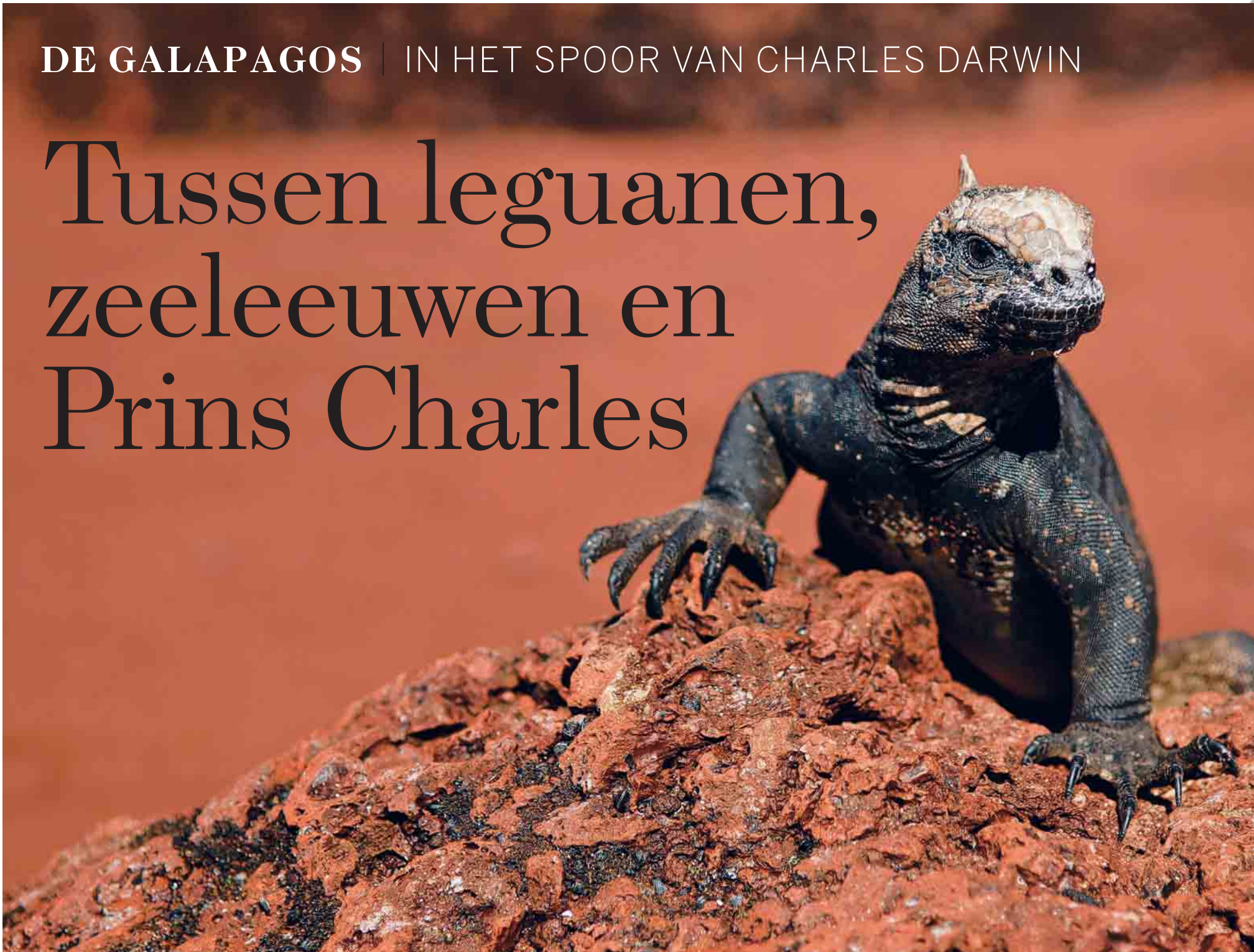
Voor ze een duik kunnen nemen in het koude water rond de Galapagoseilanden, moeten zeeleguanen zich eerst opwarmen in de zon.

Tweehonderd jaar geleden werd Charles Darwin geboren, wellicht de beroemdste bezoeker ooit van de Galapagoseilanden. Omdat 2009 Darwinjaar is, gaat Ivan Mervillie de beroemde natuurkundige achterna. Net als Darwin ontdekt hij op de eilanden een onwaarschijnlijke natuurpracht.