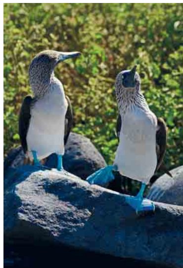
Boven: fregatvogel. Onder: blauwvoetgent; tijdens de paringsdans springt het mannetje van de ene voet op de andere.

den bezoeken en snorkelen. Dankzij de grote diversiteit in flora en fauna, biedt elk eiland telkens weer een boeiende ontdekkingsstocht.