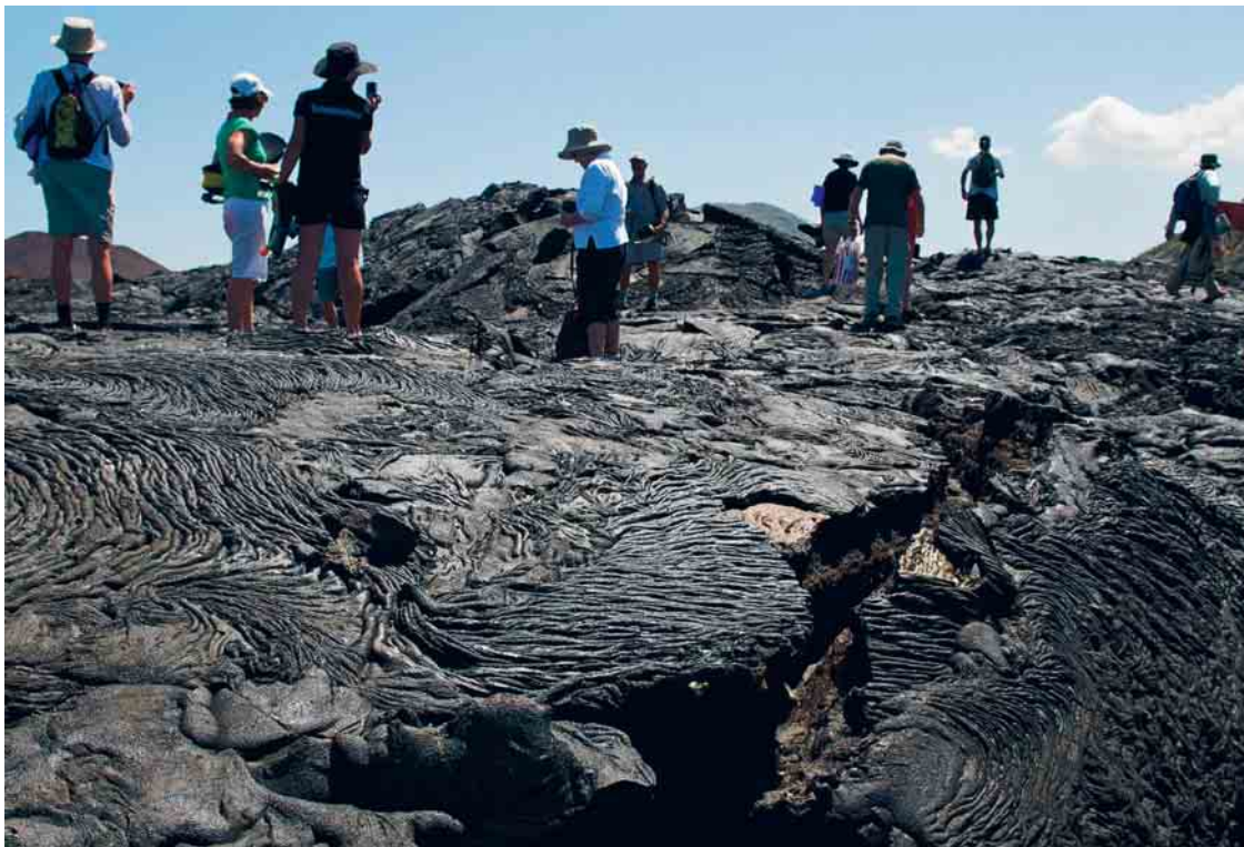
De lavabodem van Isla Santiago is amper honderd jaar oud en is nog niet geërodeerd. © Ivan Mervillie