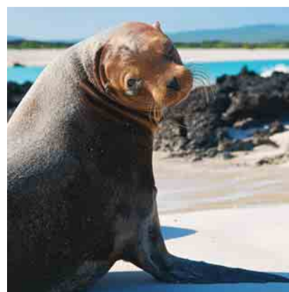
Een lome zeeleeuw.