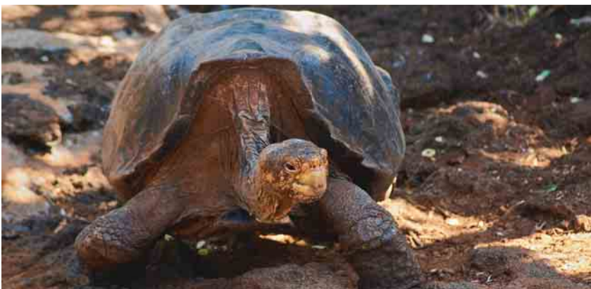
Lonesome George, de laatste der Pinta-schildpadden.

• Belangrijk: zonnebrandolie van een hoge factor (+40) is een absolute noodzaak.