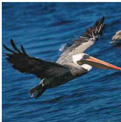
De bruine pelikaan.