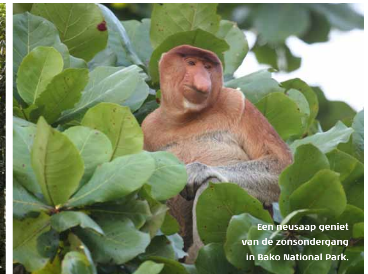
Een neusaap geniet van de zonsondergang in Bako National Park.

Eerlijk zullen we alles delen Ongelijkheid is een woord dat de Iban-Indianen niet kennen. Voedsel, drank en inkomsten worden door het stamhoofd gelijk verdeeld. Toeristen doen er daarom slim aan om cadeaus mee te nemen die eerlijk kunnen worden uitgedeeld, zoals een zak snoep. Vooral lollies worden door jong en oud erg gewaardeerd.