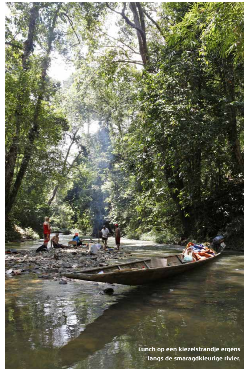
Lunch op een kiezelstrandje ergens langs de smaragdkeurige rivier.

Als de hane de nieuwe dag inluiden, trekken de mannen de jungle in om te jagen. De vrouwen gaan met grote manden op hun rug naar de rijstvelden. Wij worden door de bootman, zijn vrouw en zijn zoon vergezeld naar een ander longhouse. We varen in een kano, een uitgeholde boomstam, de smaragdkeurige rivier op en worden al snel omringd door torenhoge bomen. Ik moet denken aan de woorden van de reisgenoot van reisschrijver Redmond