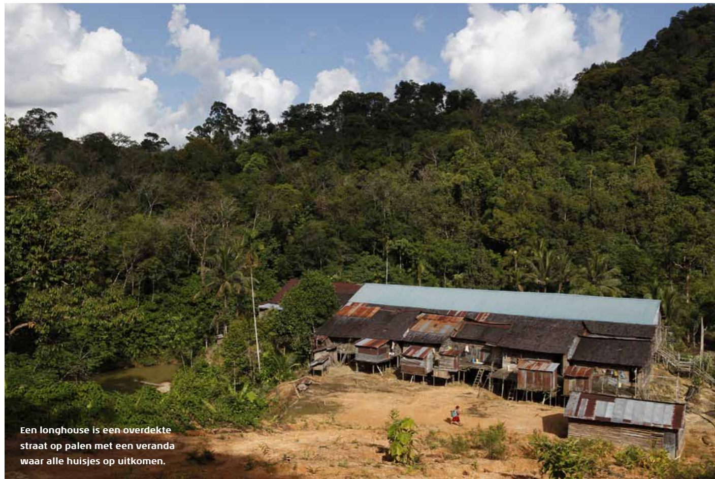
Een longhouse is een overdekte straat op palen met een veranda waar alle huisjes op uitkomen.

“Here, you drink”, zegt een mooi meisje van een jaar of vijftig terwijl ze me een glaasje aanreikt. Gids Edward fluistert in mijn oor dat ik dit welkomstrankje – tuak, ofwel rijstewijn – niet mag afslaan. De alcohol zal mijn lichaam zuiveren en ervoor zorgen dat ik geen ongeluk meeneem als ik het huis binnenga. En dat wil ik niet op mijn geweten hebben! Daarnaast weet ik dat er straks een ceremoniële dans zal worden uitgevoerd en dat ik daarna zelf aan de beurt ben voor een dansje. Aangezien ik met mijn 1 meter 75 – in Nederland een gemiddelde lengte, maar hier reusachtig – en blonde krullen nu al veel bekijks heb, lijkt een klein drankje voor het zelfvertrouwen me geen slecht idee. Ik zet mijn tas met logeerspullen in de hoek en betreed het Ngemahili longhouse aan de Lemanak rivier in Sarawak. We zijn bij de Iban, een van de oorspronkelijke volkeren van Borneo. Ooit, voordat de Iban zich bekeerden tot het katholieke geloof, waren ze gevreesd vanwege brute koppensnelpraktijken, waarbij het hoofd van de tegenstander als trofee mee naar huis werd genomen. Nu staan de Iban bekend om het behoud van hun traditionele levenswijze en hun bijzondere gastvrijheid.