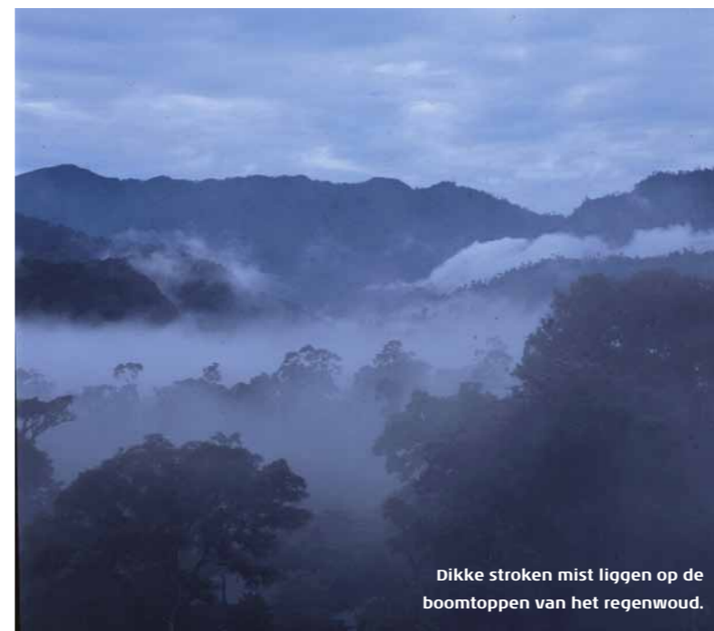
Dikke stroken mist liggen op de boomtoppen van het regenwoud.