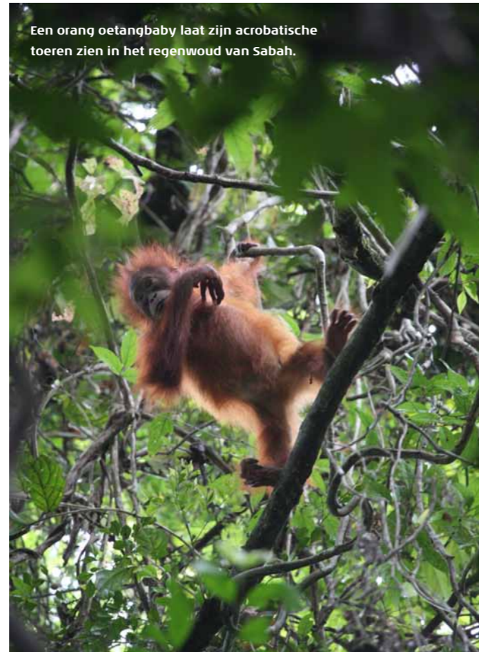
Een orang oetangbaby laat zijn acrobatische toeren zien in het regenwoud van Sabah.